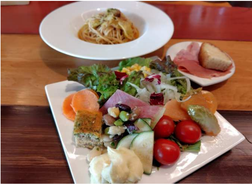
切りたて生ハム&サラダビュッフェ付き ランチセット