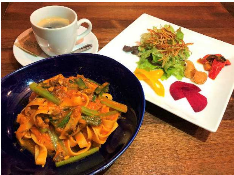
本日のパスタ(トマトソース)