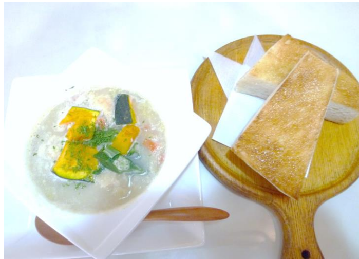
豆乳スープとバターパンセット (耳なしの場合)