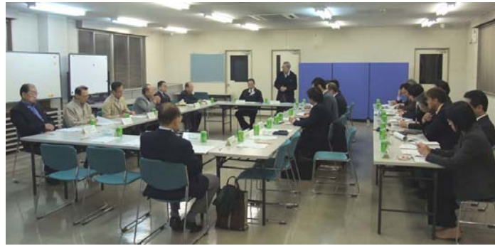
▲第9回幹事会の様子(十条駅西口再開発相談事務所にて)