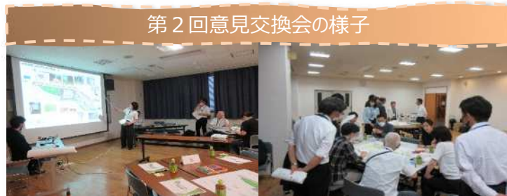
第2回意見交換会の様子