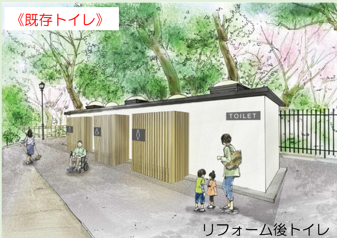
リフォーム後トイレ