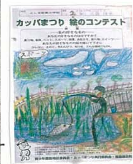
去年のコンテストに出した絵が「好きなおこし」つり