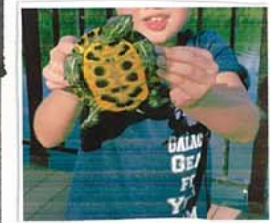
この夏一番大物は20cm アカミガメ