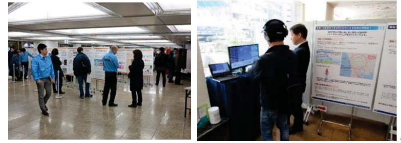
◀これまでに開催したオープンハウス型住民説明会の様子▶