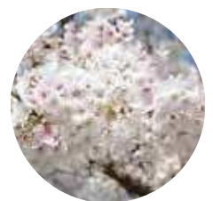
区の木 さくら City Tree: Cherry Blossom Tree 「バラ科サクラ属」 Prunus

Kita City Communication Logo (Adopted on 3 April 1996) The design incorporating cherry blossom petals and the initial "K" from Kita represents "Kita City as a place of many flowers". The linked petals symbolize transportation networks, interpersonal relationship and communications with the people who visit Kita City. The blooming cherry blossoms also give are image of the breath of spring and a new start, naissance = birth.