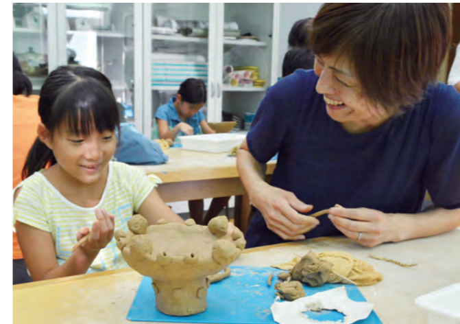
夏休み土器づくり教室