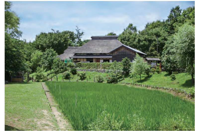
赤羽自然観察公園