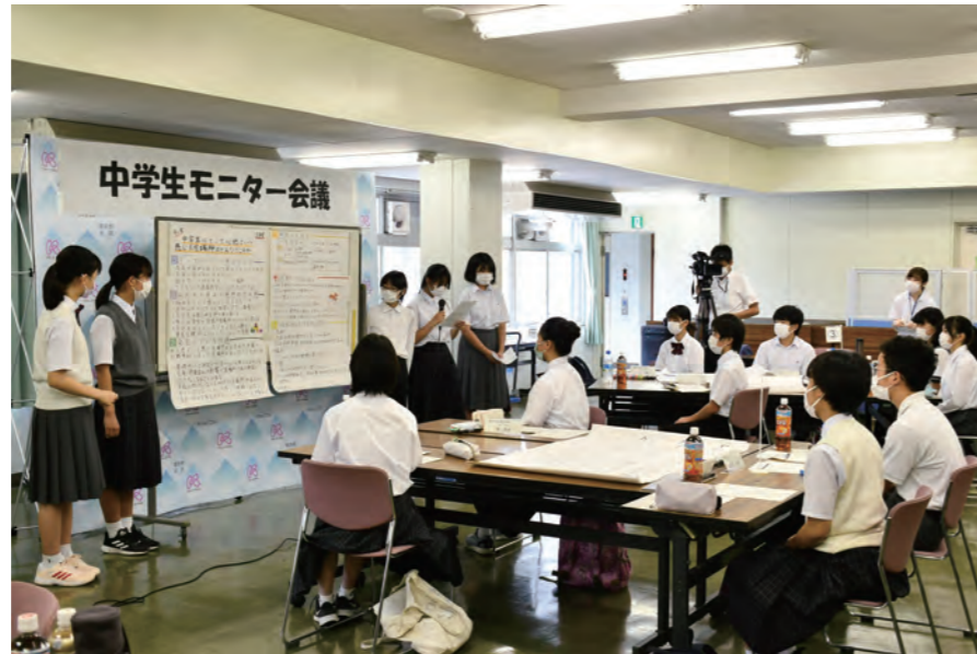
中学生モニター会議

Communal activities like festivals and volunteerism are found everywhere, Kita City is full of creative energy, and ties among people are strongly felt.