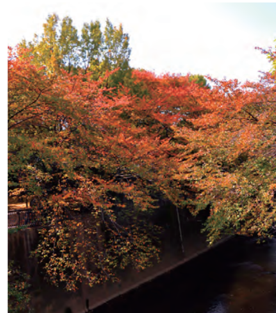
石神井川沿いの紅葉