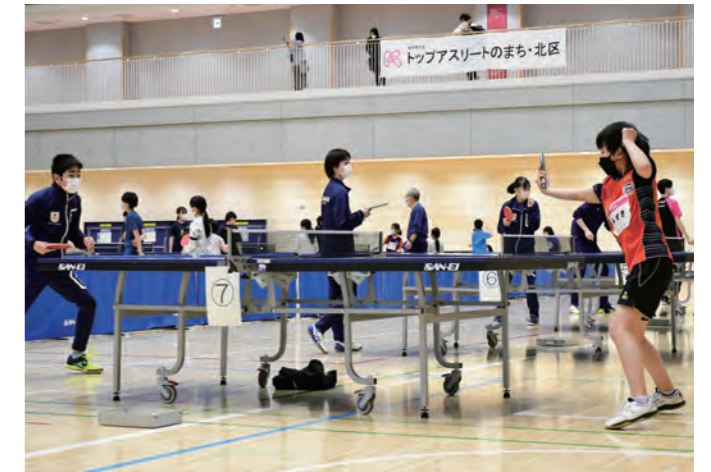
トップアスリート直伝教室