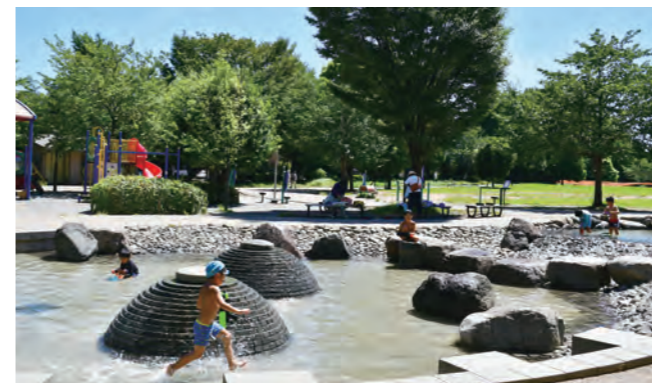
西ヶ原みんなの公園