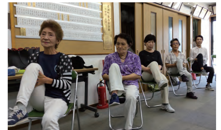
介護予防自主グループ活動