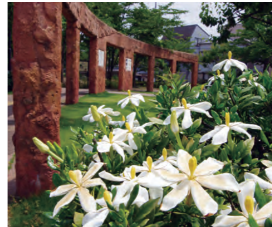
豊島馬場遺跡公園