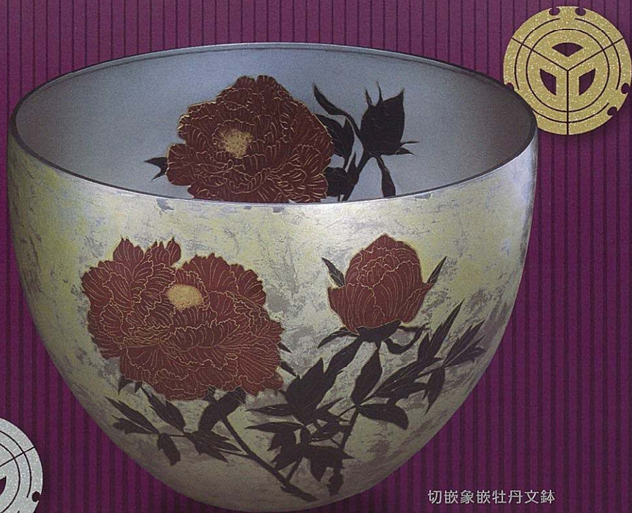
切嵌象嵌牡丹文鉢