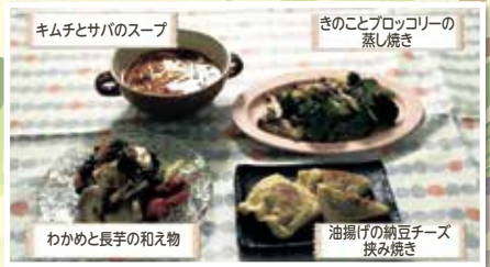
動画内で紹介しているレシピ