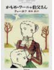
「かもめ・ワーニャ伯父さん」 チーフホフ/著 神西清/訳 新潮文庫