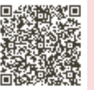
申込はこちら ②1回だけコース

=以下、共通= 師 同館学芸員 問先 〒114-0002 王子1-1-3飛鳥山公園内 北区飛鳥山博物館(月曜休館) ☎(3916) 1133