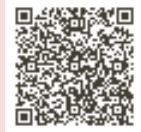
申込はこちら ①5回まとめてコース

日 第1弾「北区の地形と旧石器・縄文時代」…5月20日(土) 第2弾「弥生時代の北区」…6月17日(土) 第3弾「古墳時代の北区」…7月15日(土) 第4弾「飛鳥・奈良・平安時代の北区」…8月26日(土) 第5弾「鎌倉・室町・戦国時代の北区」…9月23日(祝) いずれも午後2時～4時 場 同館講堂 内 開館から25年の間に新たに発見された資料や、新たに分かったことをふまえて北区の歴史を時代ごとに振り返ります。※後期(江戸時代以降)は10月～2月に行います。 定 60名(抽選) 費 各回100円(資料代) 申 ①5回まとめてコース、②1回だけコース(第一弾のみ受付)いずれも往復はがき(記入例参照。往復はがきは①②の別も記入)または電子申請で、4月25日(火)(必着)まで。第2弾～5弾は今後の北区ニュースでお知らせします。 ※電子申請は午後4時まで