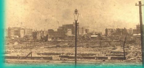
「東京駅前の焼け跡、日本橋方面」 (気象庁ホームページより) を加工