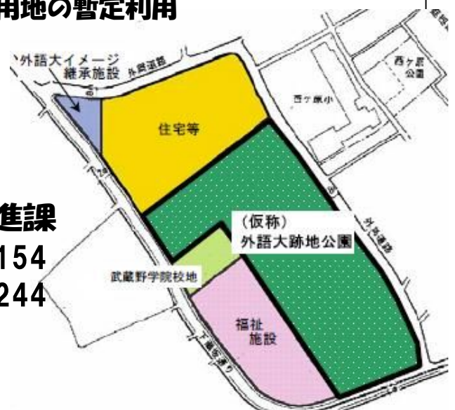
外語大跡地利用計画図