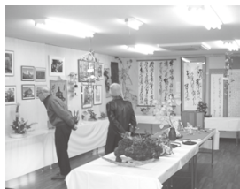
●地域の方々からの出品の数々

悠遊文化展では「昭和の赤羽回想写真展」が展示されましたが、その一角をお借りして、「志茂まちづくり協議会の活動状況」を掲示しました。