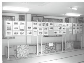
●昭和の赤羽回想写真展