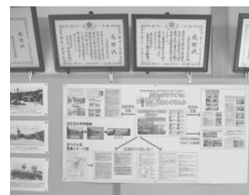
●志茂まちづくり協議会の情報提供