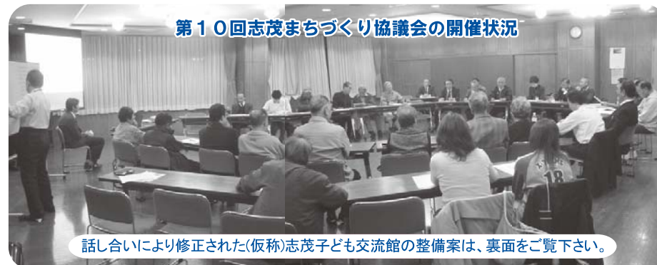
第10回志茂まちづくり協議会の開催状況

話し合いにより修正された(仮称)志茂子ども交流館の整備案は、裏面をご覧ください。