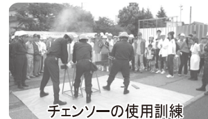
チェーンソーの使用訓練