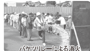
バケツリレーによる消火