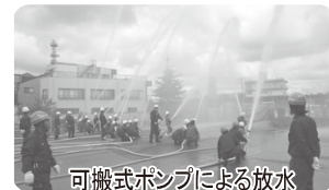
可搬式ポンプによる放水