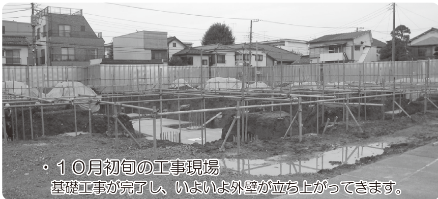
・10月初旬の工事現場 基礎工事が完了し、いよいよ外壁が立ち上がってきます。