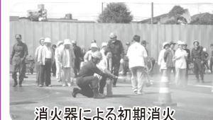
消火器による初期消火