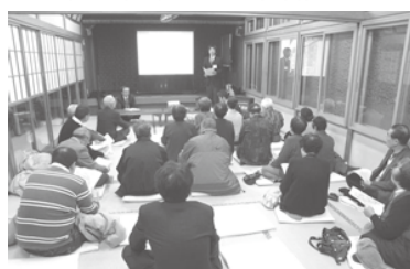
・第4回説明会開催状況

志茂3丁目では、志茂4・5丁目と同様に密集事業を導入し、日本化薬(株)用地の活用を含めた、防災まちづくりを検討していましたが、平成21年度からいよいよ志茂3丁目地区へも事業区域が拡大される予定です。1月30日には、第4回説明会が開催され、地元の皆さんへ整備計画、事業計画に関する説明が行われました。