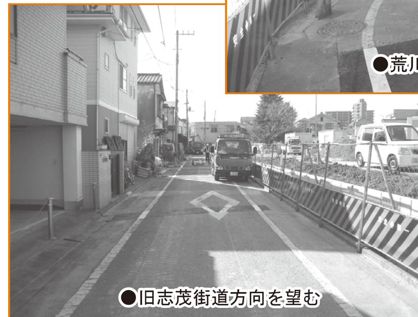
●旧志茂街道方向を望む