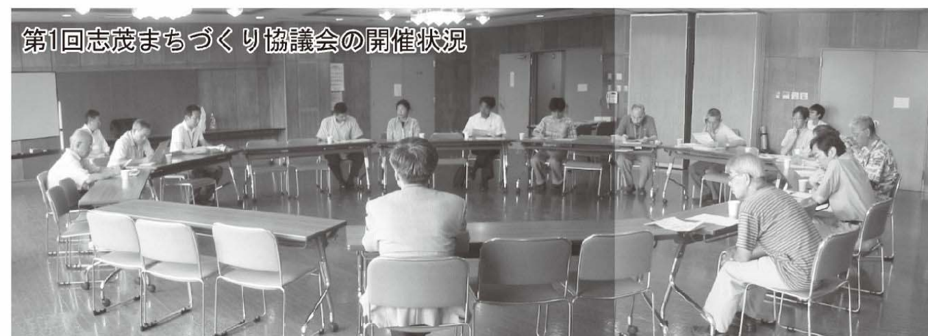
第1回志茂まちづくり協議会の開催状況