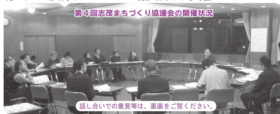
第4回志茂まちづくり協議会の開催状況