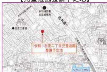
【児童遊園整備予定地】