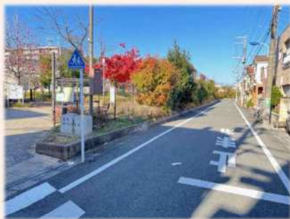
主要生活道路3・4号線