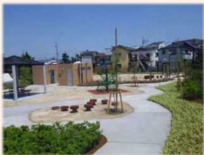
志茂三丁目小柳川公園

ただし、感染状況によって開催が延期または中止となる場合があります。ご理解のほど、よろしくお願いいたします。