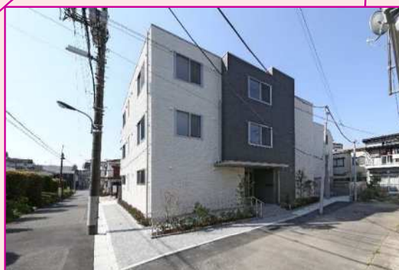
北側（壁面後退、セットバック）