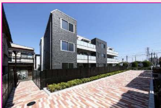
南側（隣接地区に接続、避難路機能）