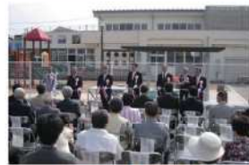
志茂ゆりの木公園開園式