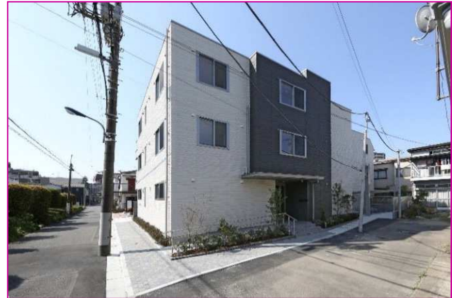
北側（壁面後退、セットバック）