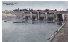
↑旧岩淵水門（赤水門） 完成当時の赤水門の色は、灰色でした。新しい岩淵水門（青水門）が昭和57年に完成し、赤水門は役目を終えました。