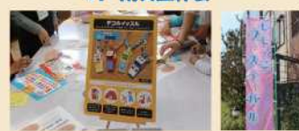
「しもっこフェスティバル」に出店し、災害時に役立つホイッスルをデコレーションする防災工作会を行いました。