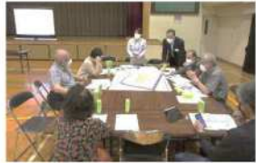
ワークショップでの意見交換の様子