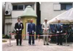
岩淵かっぱ広場開園式 （平成11年5月）