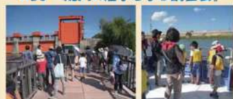
荒川治水資料館の見学、旧岩淵水門の見学、災害対策支援船「あらかわ号」に乗船し治水対策の見学を行いました。