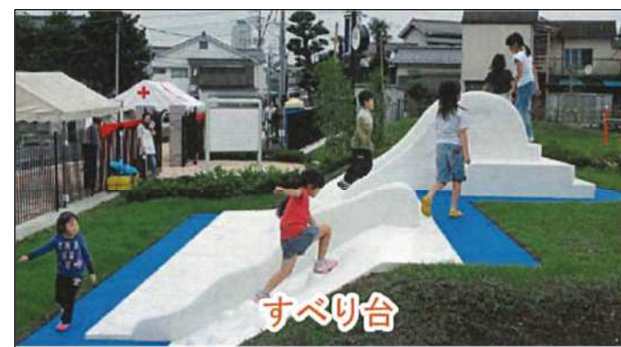
段差を利用した遊具