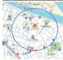
↑志茂子ども交流館から約200mの範囲で受信可能でした。