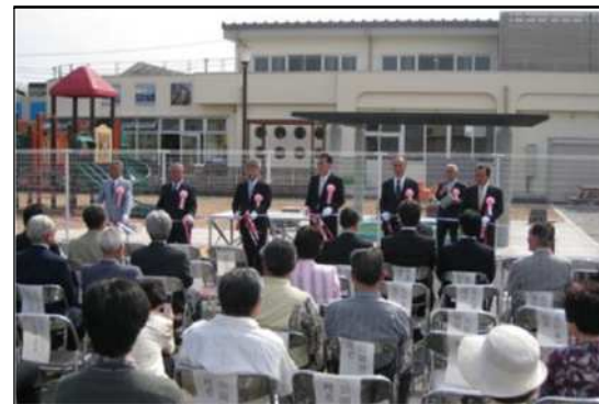
志茂ゆりの木公園 開園式