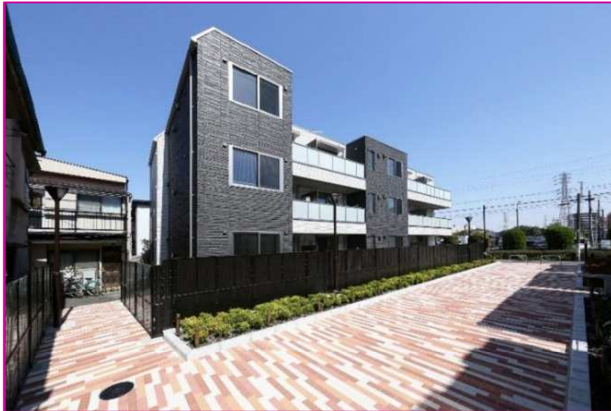
南側（隣接地区に接続,避難路機能）