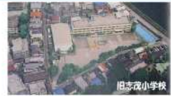
旧志茂小学校