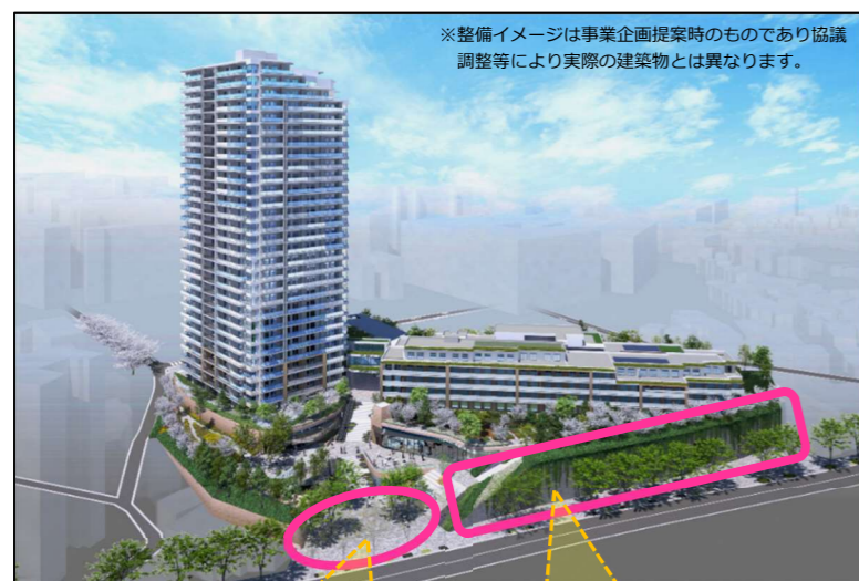
※整備イメージは事業企画提案時のものであり協議調整等により実際の建築物とは異なります。