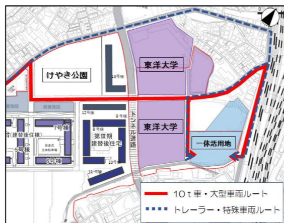
▼ 工事車両ルート図