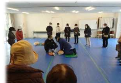
◆AED・心臓マッサージ体験