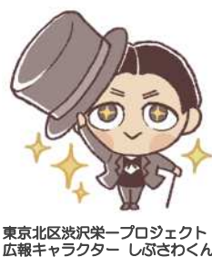
東京北区炭沢栄プロジェクト 広報キャラクター しぶざわくん

コロナウイルス感染拡大防止のために、キャンパスへの入構は限定されていましたが、4月にオープンする図書館・カフェなどを、地域の方々に開放していくことについて、東洋大学と現在協議しています。