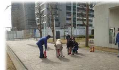
◆消火器の放水体験

約70名が参加され、消防署に協力いただき、消火器の放水や仕切り板の破壊、AED・心臓マッサージの体験など、様々な訓練を行いました。