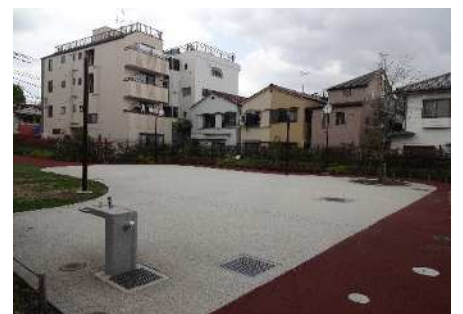
■ 西ヶ原地区 谷戸さんさん児童遊園