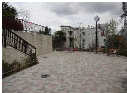
■ 西ヶ原地区 道音坂児童遊園

日常的な憩いの場、災害時には有効なオープンスペースになる身近な公園や広場の整備を進めます。また、公園・広場整備に併せて防災施設の設置を行うなど地域の防災性の向上に努めます。