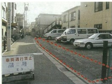
主要生活道路の拡幅整備

災害時における安全な避難や消火・救援活動を行う地域の防災軸となる「主要生活道路の拡幅（6m以上）」や「幅員が4m未満の細街路」の整備を進めています。