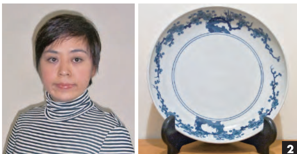
1 フリーカップ「ロビンフッド」(左)、「雷文菊づくし」(中)、「海遊記・内七宝地文」(右) 2 大皿(梅文皿)

高橋友穂さんは芸術系大学を卒業後、陶芸職人になりたいと佐賀県の有田で染付を学びました。そして、有田焼を代表する窯元で掻き落としや染付などの仕事に従事しました。人間国宝の職人がいる有田のなかで多くの薫陶を受けた後、故郷の北区に帰ってきました。