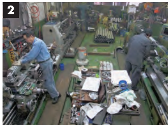
1 ダイナミックバランシングマシン。ロールの高速回転に対応した釣合い良さに調整が可能。 2 作業場内

佐藤一寿さんが経営する佐藤機械は、佐藤さんの父、春雄氏が1965年に創業した印刷機用ロールやシャフトの製作で定評のある会社です。