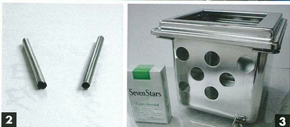
1 作業風景 2 チタンの丸深絞り 3 大久保さんが作成した筐体

大久保賢司さんは56年にわたる深絞り加工の経験を持ちます。大久保さんは時代の移り変わりとともに様々な工業製品の部品を製作してきました。深絞りに従事して間もない頃はライターの筐体や一眼レフカメラの軍艦部等を製作していました。エレクトロニクス製品の普及とともに、第一世代の携帯電話に使われた電池ケースやパイプモーターの筐体、デジタル体温計の先端部等も製作してきました。