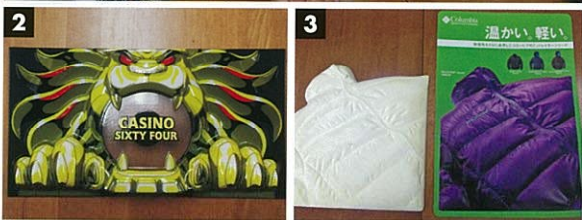
1 菅原勇さん(右)と笠原会長(左) 2 遊戯台の装飾部品 3 石膏型(左)と立体ポスター(右)

ジャパン・プラス(株)は梱包材や緩衝材を製造販売し、アイデアで真空成型技術を活かして、多種の製品を提案しています。菅原勇さんは同社で搬送用トレー等の石膏型(マスター)の製作に30年間従事し、同社の得意とする立体ポスターのマスター製作では、熟達した技能を発揮して、客先からも高い評価を得ています。