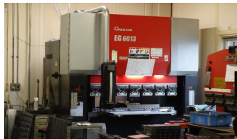
高速・高精度サーボベンディングマシン

○一貫生産体制でほとんどの業務を社内ですべて完結することができ、ご要望に対して柔軟かつ臨機応変に対応いたしますので、お気軽にご相談ください。