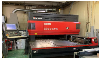
レーザーカッティングマシン