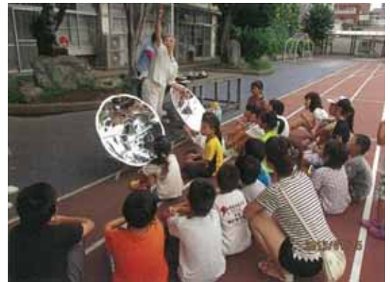
ソーラークッカー