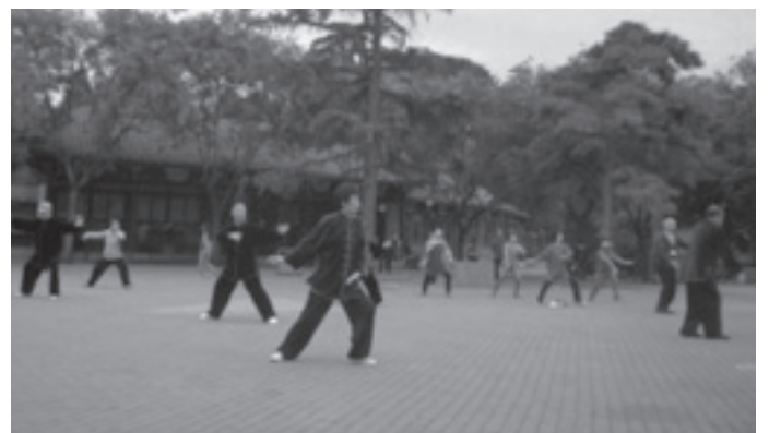
타오란팅 공원에서 아침 수련