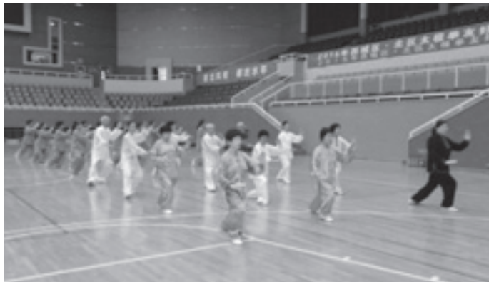
태극권 교류 대회