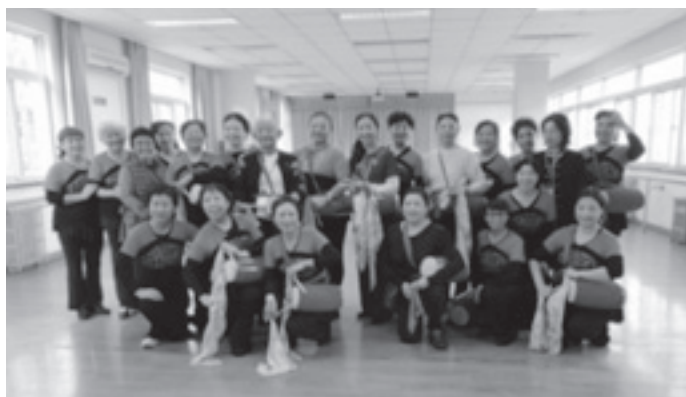
月壇地区コミュニティセンター交流