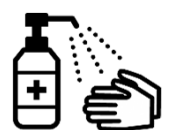
手指消毒用アルコール による消毒の励行

新型コロナワクチンの有効性・安全性などの詳しい情報については、厚生労働省ホームページの「新型コロナワクチンについて」のページをご覧ください。